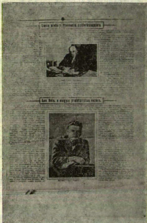
BALOLDALT: A VILÁGFORRADALOM C. LAP 1920. MÁJUS 1-I SZÁMA JOBOLDALT: E LAP 3. OLDALA LENIN ÉS KUN BÉLA ELVTÁRSÁK FÉNYKÉPEVEL

Ezt az országban egyedüli lapot Paróczai Mihály csongrádi kubikos 1922. május 4-én hozta haza Szovjet-Oroszországból. A határon szigorú ellenőrzésen estek át az Oroszországból hazatérő volt hadifoglyok. Veszélyes vállalkozás volt tehát Lenin és Kun Béla elvtársak képét hazahozni, abban az újságban, mely éppen a „Vörös Május”-t köszönti.