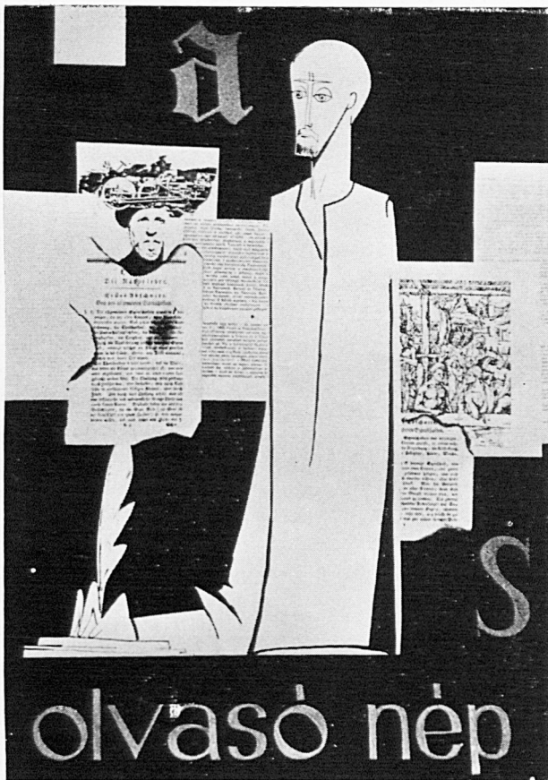
TANDI LAJOS PLAKÁTJA (III. DÍJ)

Krónika rovatunk élén hírt adunk a Szegeden rendezett „Olvasóvá nevelés” c. ankétról, amelynek egyik példaadó eseménye a Szegedi Tanárképző Főiskola rajzszakos hallgatóinak plakátterv-kiállítása volt.