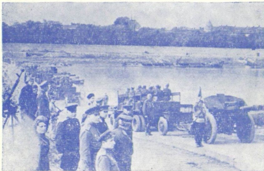
A FÖLSZABADÍTÓK ELSŐ OSZLOPA