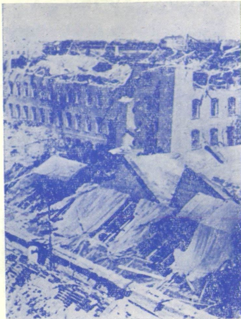
AZ ÚJSZEGEDI KENDERGYÁR ROMOKBAN 1944.