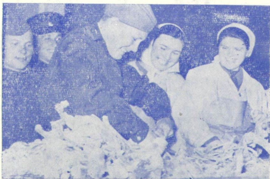
SZOVJET HARCOS — HÚSIPARI MUNKÁS — A SZALÁMIGYÁRBAN