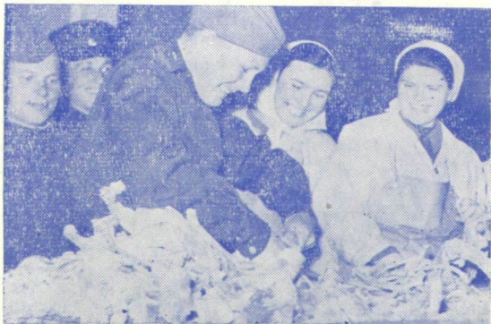
SZOVJET HARCOS — HÚSIPARI MUNKÁS — A SZALÁMIGYÁRBAN