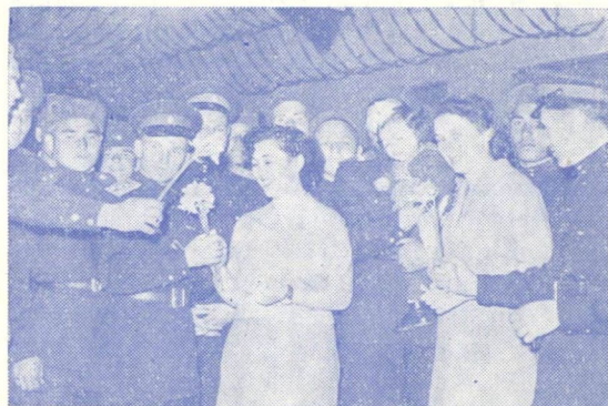
A FÖLSZABADÍTÓ SZOVJET HADSEREG KATONÁI A KONZERVGYÁRBAN