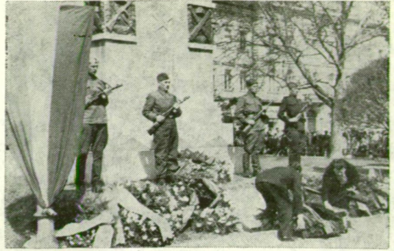
AZ ELSŐ DÍSZÖRSÉG A HŐSÖK EMLÉKMŰVENEL

(Az alábbi három kép Liebmann Béla munkája.)