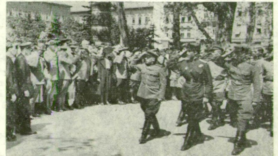
A FÖLSZABADÍTÓK DÍSZMENETE