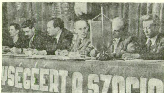
GYÜLÉS A MUNKÁSEGYSÉG JEGYÉBEN