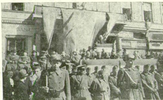
AZ ELSŐ SZABAD MÁRCIUSI IDUS: 1945. MÁRCIUS 15.