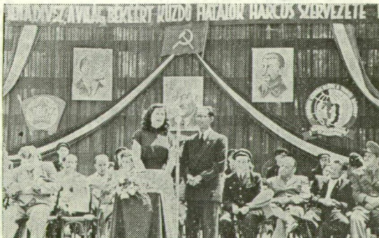
IFJÚSÁGI NAGYGYŰLÉS ÚJSZEGEDEN