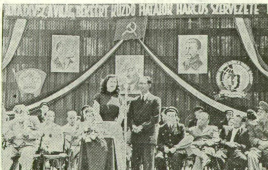
IFJÚSÁGI NAGYGYŰLÉS ÚJSZEGEDEN