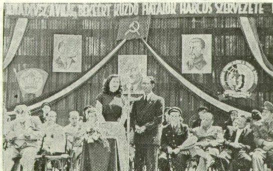
IFJÚSÁGI NAGYGYŰLÉS ÚJSZEGEDEN

Az Ideiglenes Nemzetgyűlés megalakította az Ideiglenes Nemzeti Kormányt.