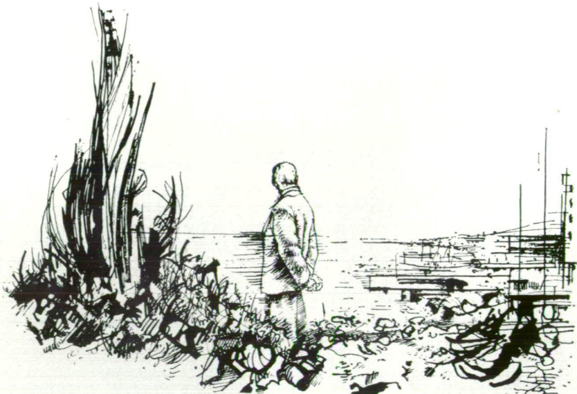
BOZSIK ISTVÁN RAJZA