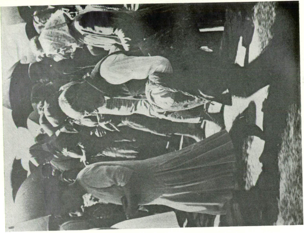
KÁRÁSZ JUDIT SZOCIOFOTÓI