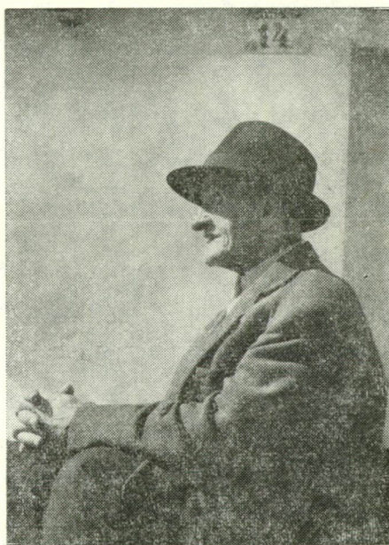
ÖREGEN, AMIKOR MÁR NEM FESTETT