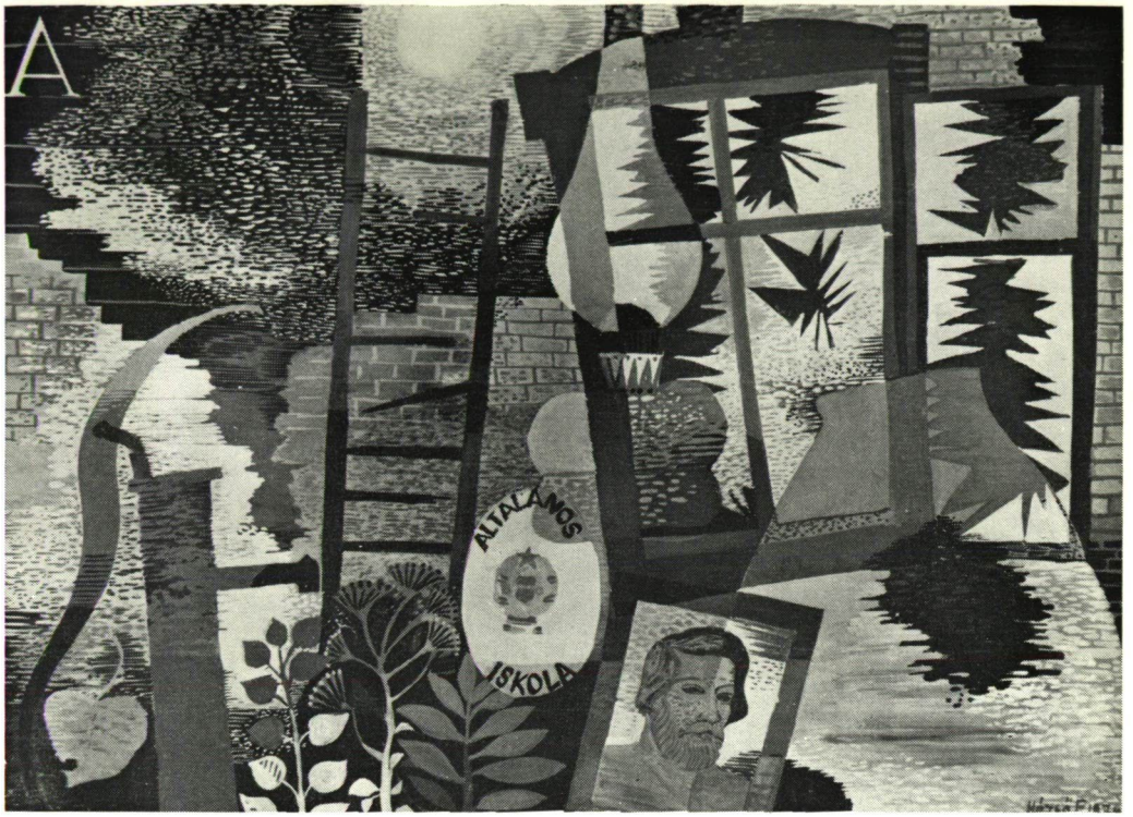
RÉKVIEM EGY TANYAI ISKOLAÉRT