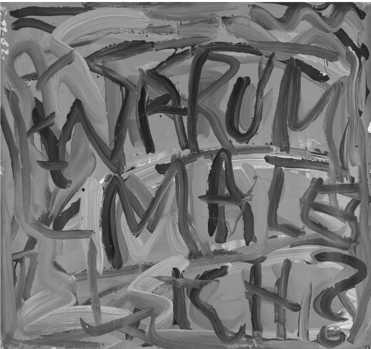
Tótt Endre: Warum male ich, 1982 (akril, papír 104×111 cm)